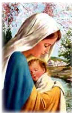
Benedetto il Signore che viene!

17.00 Vespri con Esposizione e Benedizione col Ss. Sacramento